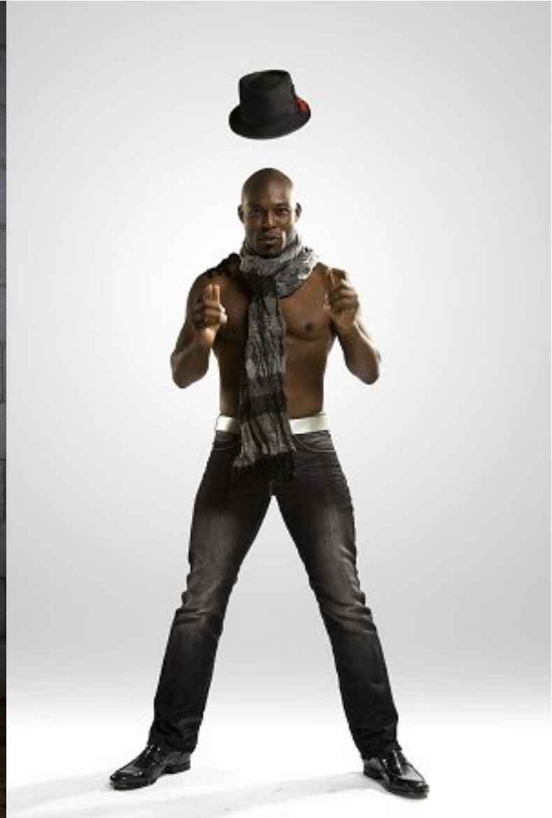
JIMMY JEAN LOUIS