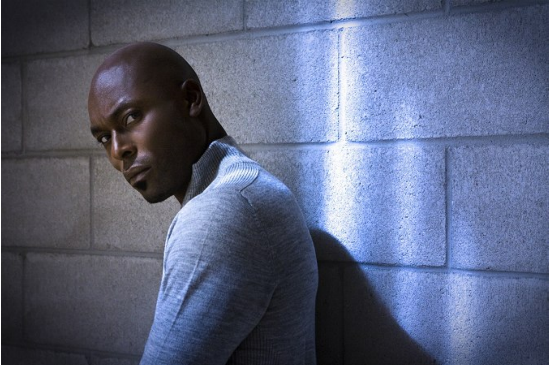
JIMMY JEAN LOUIS