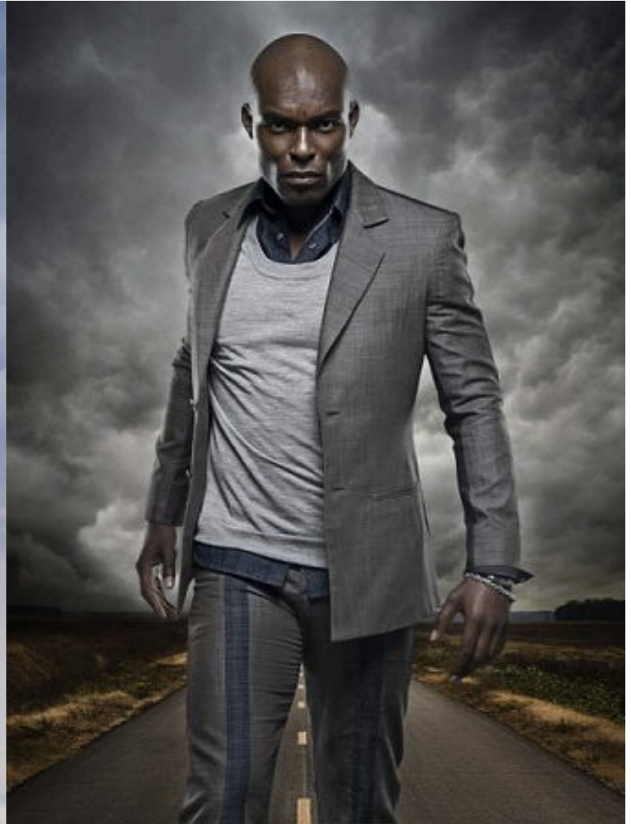
JIMMY JEAN LOUIS