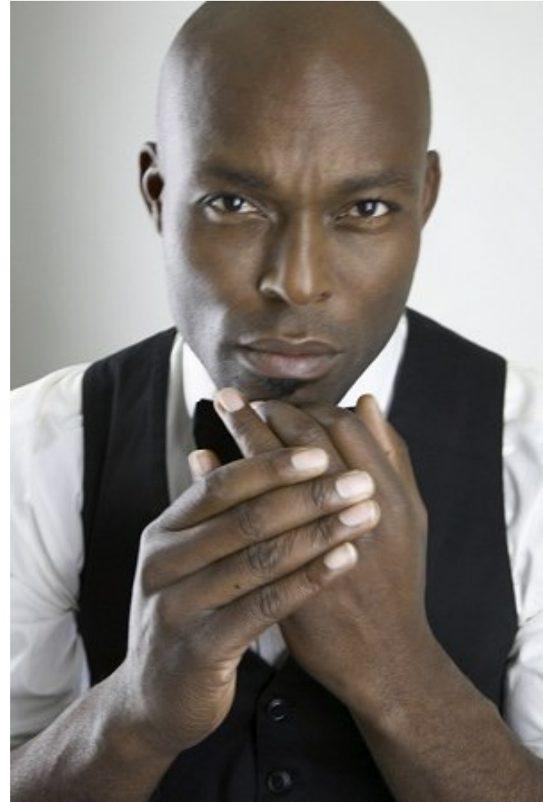
JIMMY JEAN LOUIS