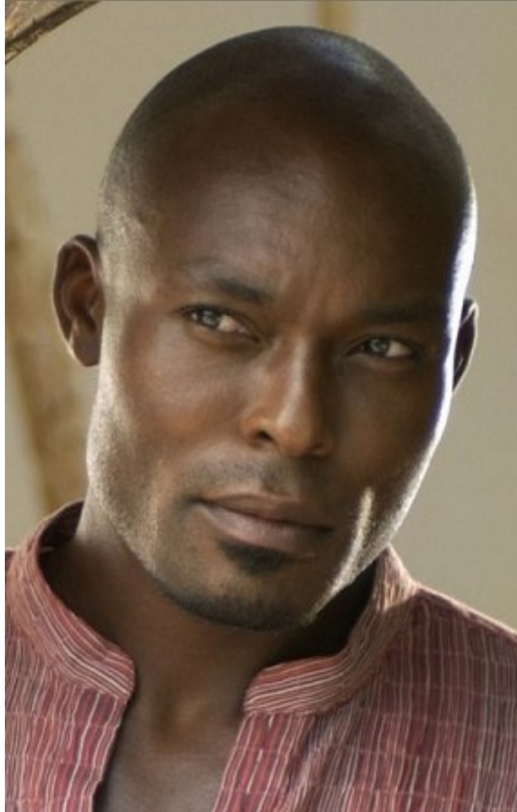
JIMMY JEAN LOUIS