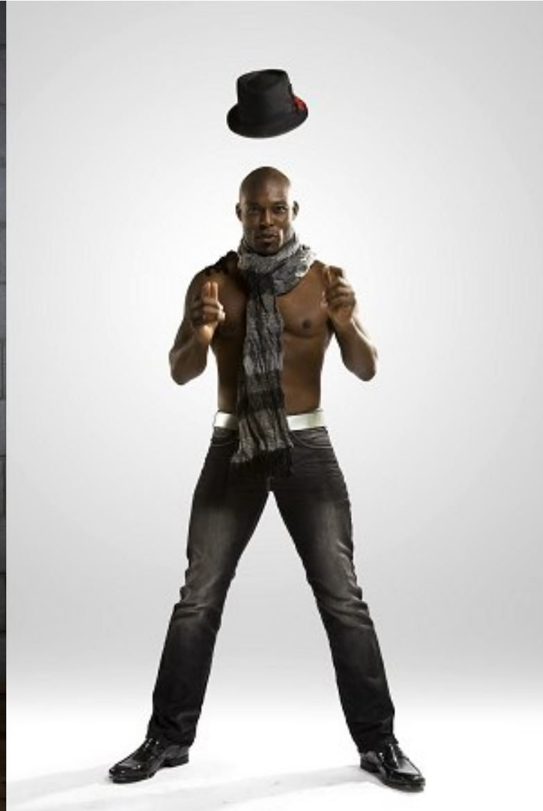
JIMMY JEAN LOUIS